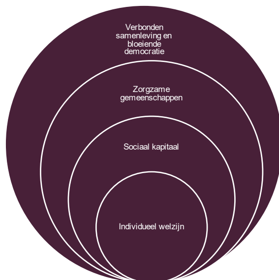
Figuur 1: De meervoudige waarde van sociaal contact