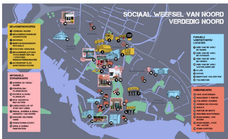
Figuur 2: Voorbeeld van een 'sociale infrastructuur', bestaande uit zowel informele als formele plekken, in dit geval van Amsterdam Noord.

Een architect die het altijd heeft over het belang van contact en interactie, is Herman Hertzberger. Sinds het begin van zijn loopbaan probeert hij ruimtelijke condities te scheppen voor de basale behoefte aan contact. Zijn bekendste ontwerp vondst is de tribunetrap, waarop je kunt zitten, werken en kletsen. Ook iemand als Jan Gehl heeft van uit die invalshoek pleidooien gehouden voor 'levendige plinten' bij hoogbouw en het idee om steden vooral 'op ooghoogte' te ontwerpen.